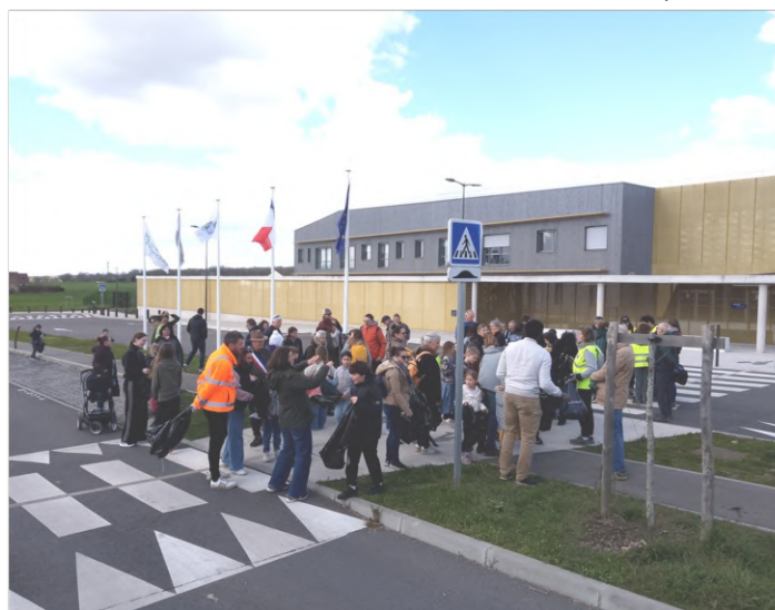
Les bénévoles au départ du Lycée Joséphine Baker

Une belle démonstration d'engagement collectif qui prouve que chaque geste compte pour préserver notre environnement.