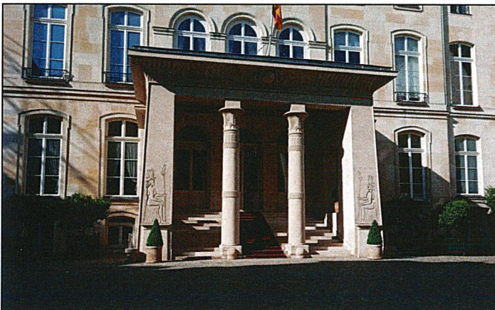
L'entrée de l'hôtel de Beauharnais, dans le 7 ième arrondissement