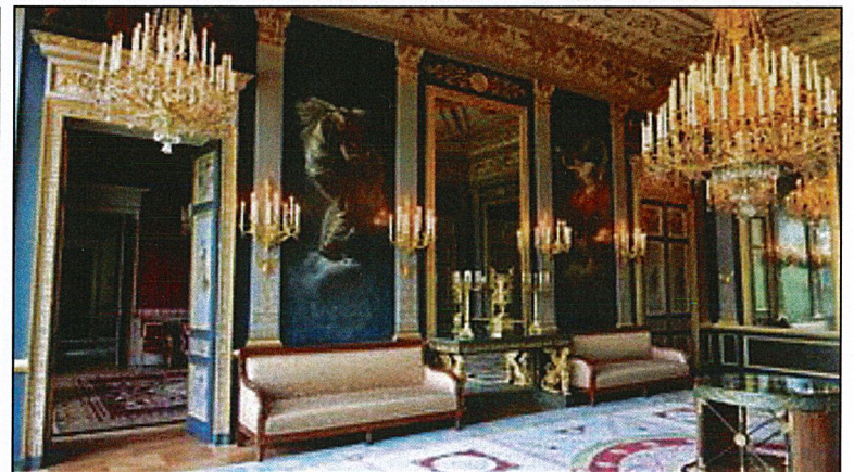
Un des salons de l'hôtel de Beauharnais

La visite de l'hôtel de Beauharnais faisait suite aux contacts pris avec le représentant de l'Ambassadeur d'Allemagne, Ambassadeur qui avait été invité à honorer le 55 ième anniversaire de notre jumelage. Pour en savoir plus sur la résidence de l'Ambassadeur : https://allemagneenfrance.diplo.de/fr-fr/missions-allemandes/botschaft-seite/4-residence/-/2492324