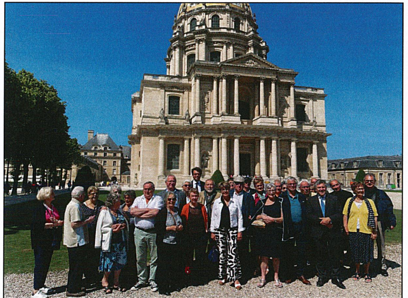
Les adhérents du Comité aux Invalides