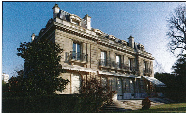
La Villa Windsor dans le Bois de Boulogne

Le Comité travaille sur un programme d'activités qui sera détaillé lors de la prochaine assemblée générale, assemblée qui aura lieu le samedi 3 février 2024 dans la salle des fêtes de Hanches. En prévision : un voyage d'adhérents en mai vers notre Landkreis jumelé et une journée de visite à Paris pour découvrir, entre autres, la mythique Villa Windsor, haut lieu de l'amitié franco-britannique, en cours de restauration sous l'égide de la Fondation Mansart.